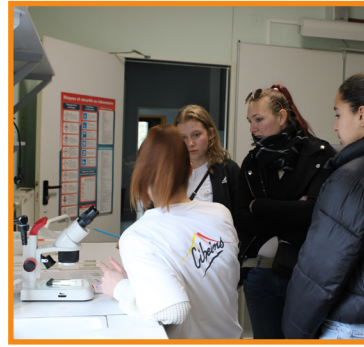
Présentation des travaux