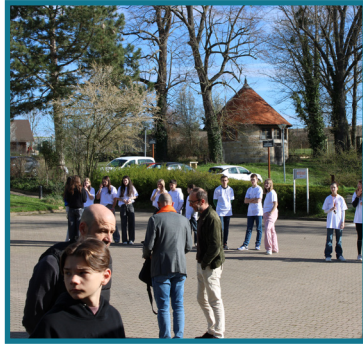
Accueil des visiteurs par les élèves