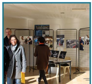
Exposition photos filières