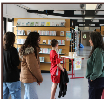
Présentation du CDI