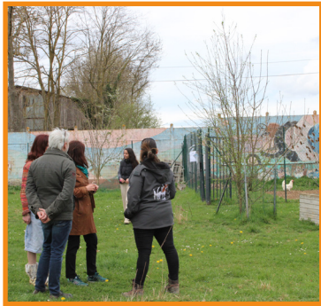
Présentation des options Sciences et Nature et Hippologie / Équitation