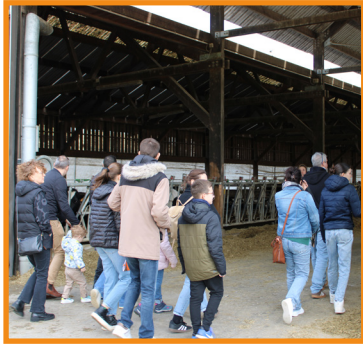
Visite de l'exploitation agricole