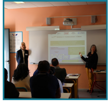
Présentation de la 2 nd e GT