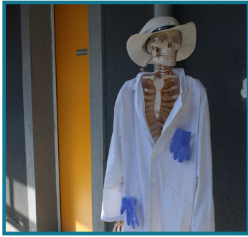
Accueil aux laboratoires