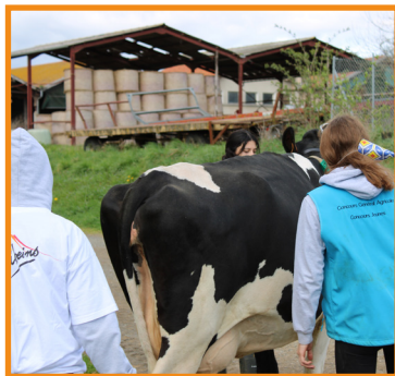
Préparation et présentation de Toise par l'équipe du TIEA