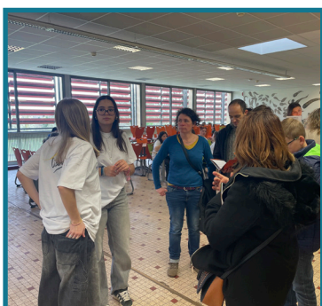
Présentation de la restauration participative