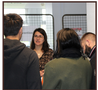
Pôle apprentissage et formation continue