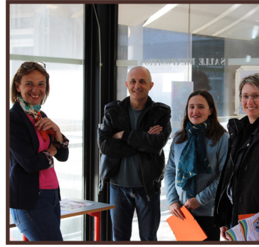
Présentation des travaux d'élèves