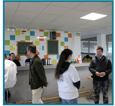
Présentation du foyer des élèves