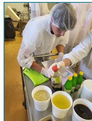
4. Préparation des différents ingrédients