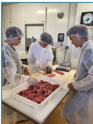
1. Découpe d'une partie des filets frais

Après s'être rendu une dernière fois au lycée des Sardières pour fabriquer un nouveau lot de rillettes aux saveurs japonaises, les élèves de première Bac Pro Aqua maîtrisent maintenant toutes les étapes de la fabrication à partir de filets de carpe de Dombes.