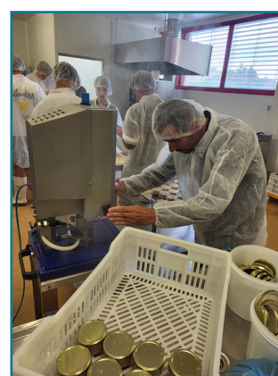
7. Sertissage des bocaux avant passage à l'autoclave

Le cycle « Valorisation des poissons d'eau douce » est à présent terminé. Ce MAP sera renouvelé l'année prochaine avec une nouvelle classe. Nous remercions nos partenaires pour l'accompagnement de nos élèves : le Fumet des Dombes, Chef GEOFFROY et le lycée des Sardières.