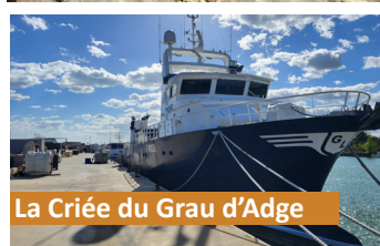
La Criée du Grau d'Adge