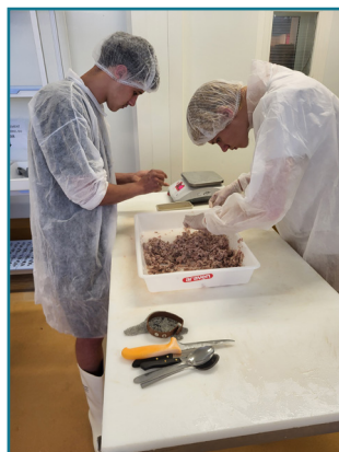
3. Désarêtage des filets pochés