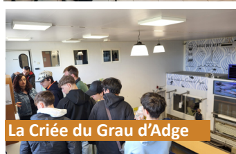
La Criée du Grau d'Adge