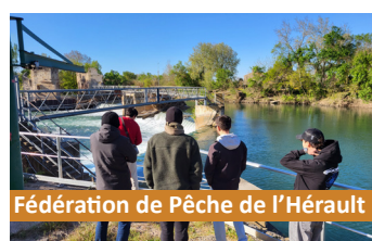
Fédération de Pêche de l'Hérault