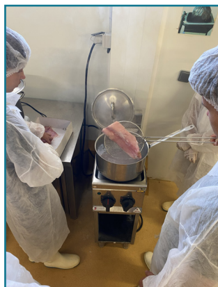
2. Pochage de l'autre partie des filets