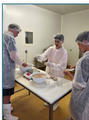
6. Mise en pot de la préparation