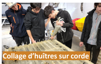
Collage d'huîtres sur corde