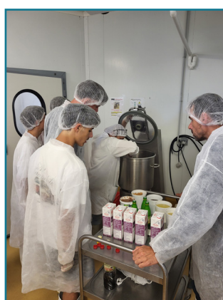
5. Mélange des ingrédients au cutter