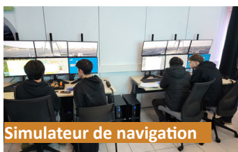
Simulateur de navigation